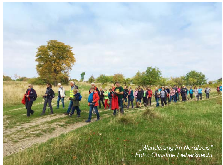
„Wanderung im Nordkreis“

Flankiert wird die Begleitung durch die Präsidentin des Thüringer Wanderverbandes, zugleich Ministerpräsidentin a.D. und Bewohnerin unserer Gemeinde, Frau Christine Lieberknecht.