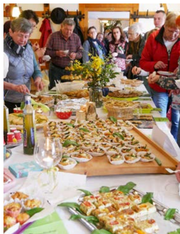
Verkostung am Buffet

Allen Beteiligten ein herzliches Dankeschön! Doch besonderen Dank gilt den Wettbewerbsteilnehmern, die ihre Bärlauch-Kochkunst erstmals wieder seit 2019 zur Verfügung stellten.