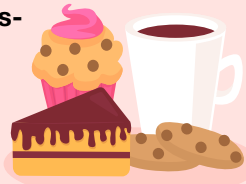
Grafik von "robertav1_2_sidr" auf Freepik