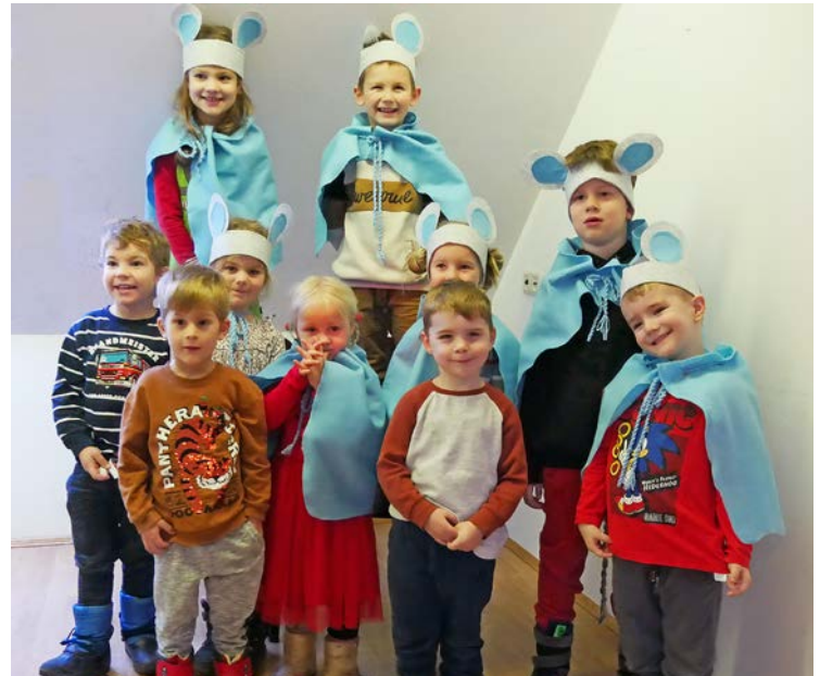
Die kleinen Darsteller der Geschichte um Frederic

In gemütlicher Runde beisammensitzend, öffnete sich die Tür auch für den Nachwuchs aus dem „Paulinenstift“. Sie sangen und erzählten in erfrischender Weise von Winter- und Weihnachtsfreuden, aber auch von -nöten in der kalten Jahreszeit und öffneten so die Herzen der älteren Generation.