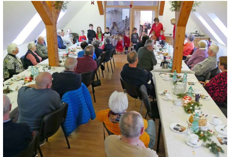
Über 30 Senioren folgten der weihnachtlichen Einladung ins Gemeindehaus

Der finanzielle Gürtel wurde um ein paar Löcher enger, jedoch nicht ganz zugeschnürt. So lud man ins Gemeindehaus ein, wo eine festlich gefüllte Kaffeetafel an nichts fehlen ließ.