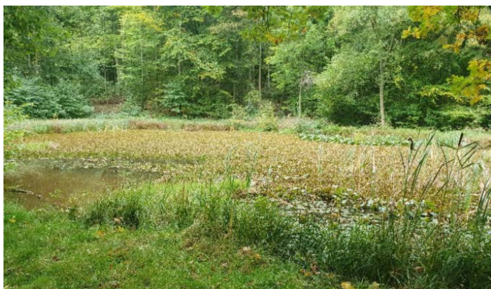
Abbildung 2: Vorher @LydiaMeyer

Darauffolgend wurde an diesen Gewässern eine Elektrofischung durchgeführt, um den aktuellen Fischbestand zu kontrollieren und durch gezielte Entnahmen die Erhaltungsbedingungen für Amphibien und Libellen zu verbessern.