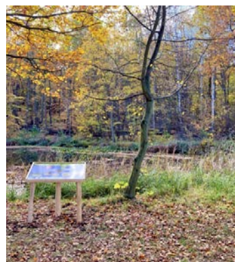
Abbildung 3. Aufgestellte Informations- onstafel mit Blick auf das Gewässer im Klosterholze

Für die Öffentlichkeit wurden abschließend zwei Informationstafeln in Pultform erstellt. Diese informieren über den Lebensraum Gewässer. Unterschiedliche Texte, gezeichnete charakteristische Tiere und viele Fotos laden sowohl Groß als auch Klein zum Kennenlernen und Weiterlesen ein!