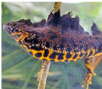
Abbildung 1: Nördliches Kammolchmännchen in typischer Wassertracht

Im Wald auf dem Ettersberg befinden sich zahlreiche dauerhafte Stillgewässer, wie kleine Teiche und wassergefüllte Erdfälle.