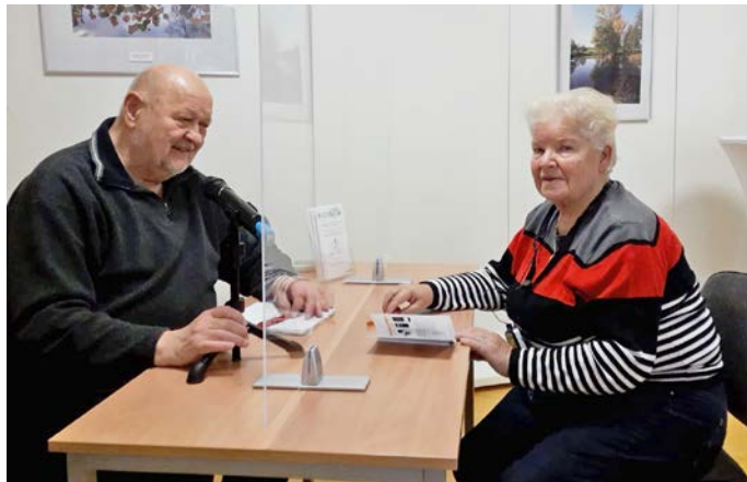
Foto: : Beratungsgespräch 2022, Haus des Miteinander Hörens im DSB Ortsverein Weimar e. V. / Lutz Krause 2022

Sozialer Dienst für hörgeschädigte Menschen in Thüringen „Haus des Miteinander Hörens“ Telefon: 03643 4221 55 / Fax: 03643 4221 57 Mittwoch: 10:00 – 12:00 Uhr und 14:00 – 17:00 Uhr E-Mail: sozialerdienst@dsb-lv-md.de Internet: www.dsb-landesverband-md.de