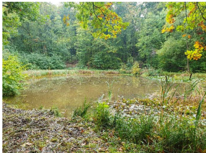
Abbildung 2: Nachher-Vergleich zur Maßnahme Krebsscherenentnahme im Oktober 2023