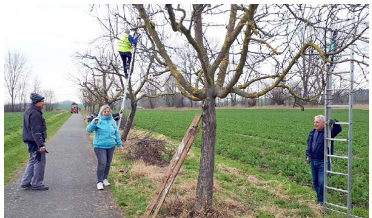
Fortsetzung auf der nächsten Seite

Aufgrund der warmen Witterung fanden wir uns bereits Anfang März zu 4 Terminen bei der Obstbaumpflege und Beseitigung des Schnittrückens zusammen. Sowohl am Palmberg als auch am Radweg wurden im Jahr 2023 durch den Verein mehrere Nachpflanzungen von Obstbäumen durchgeführt und auch dafür die Pflege übernommen. Unterstützung erhielten wir dabei von der VR Bank.