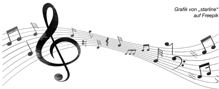
Grafik von „starline“ auf Freepik